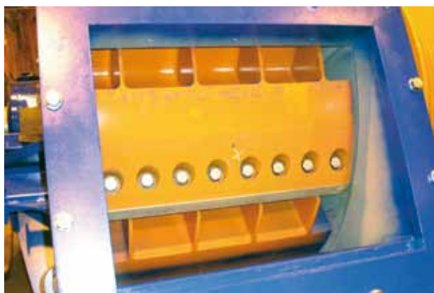
Väl genomtänkt knivfästning för snabb ompostning och med samtliga delar utbytbara.

rotorn friläggs när du lyfter kåpan. Motstålshyllan är upphängd på brytbultar för att minimera skador vid t.ex. skrotkörning. Samtliga delar kring huggkniven är utbytbara.